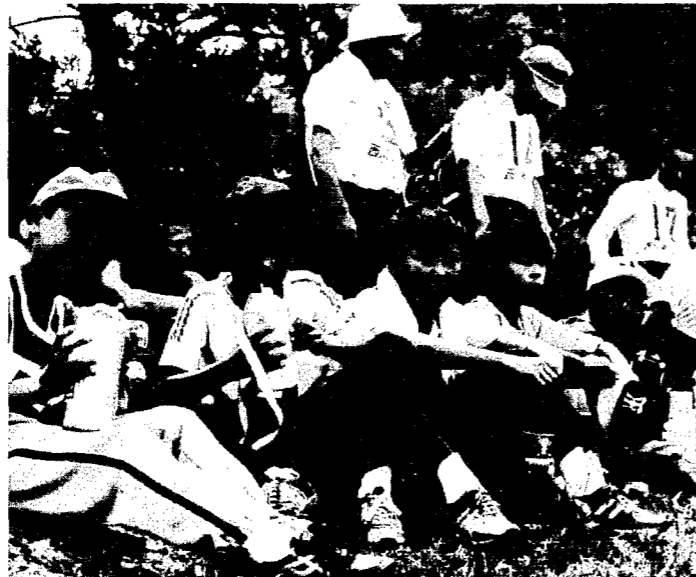
ちょっとひと休み