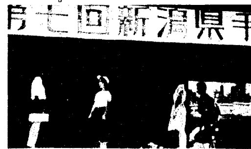
西川町青少年育成町民会議

をスローガンに、長岡市・新潟市・十日町市・南魚沼・水原町その他の支部が参加し、手話劇などを行いました。私たち、たつの子会も「こじきと女神」という手話劇を行いました。 わずか、夜四日間の練習で参加したのですが、優秀賞を頂きました。県内の会員の皆様とも心のふれあいを高めることが出来て喜んでおります。 入会を希望される方は、お気軽にどうぞ、お待ちしております。 連絡先 西川町社会福祉協議会 (役場住民課内) TEL 311-3111(代)