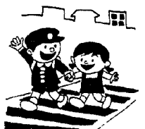
横断歩道を歩むときの手びくめてをわたりましょう。

●歩道のない道路では、必ず道路の右端を一直線に歩きましょう。●登校・下校のときは、決められた通学路を通りましょう。●道路では絶対に遊ばない。あき地や広場・遊園地などで遊ぶようにしましょう。●自転車は道路の左端を一直線に並んで、安全な速度で通るようにしましょう。●自転車の練習は、車の通らない安全なところでしましょう。●行楽期のドライブは... ●行楽にうかれて、スピードの出し過ぎ、無理な追い越し運転をしないよう一人一人が注意しましょう。●飲酒運転は絶対にしない。少しくらいと思う一杯が、大きな事故につながります。●無理な計画を立てないで、余裕をもって、疲れたら適当な休憩をとりましょう。