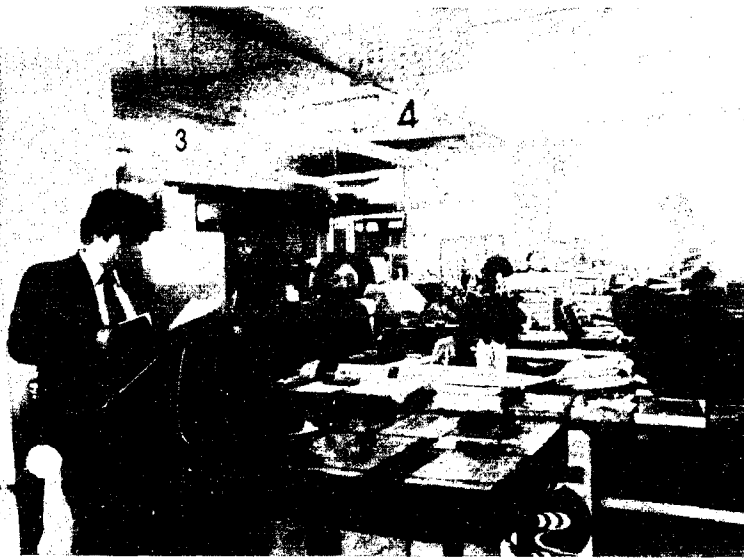
▲住所等が変わったら14日以内に手続きを

世帯主が死亡、転出、転居等をしたとき残された世帯に世帯主の変更があった場合は、住所を異動せずに世帯主を変更した場合。