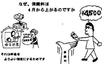
なぜ、保険料は4月から上がるのですか

ただし、少ない負担で多くの年金を望むことでは、いかに充実した制度となってもその裏付けとなる年金財政が確立していなければ、それこそ「絵にかいたモチ」に終わってしまいます。