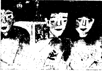
題「ふくろを作る友だち」