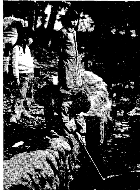
水辺での遊びは危険がいっぱい

女性及び中高年齢の健康増進と親睦、併せてソフトボールの普及を目的とし、公民館及び体育協会の主催で次のとおり開催しますので多数参加ください。 ○日時 六月二十九日(日) 午前八時から ※雨天の場合七月六日(日) ○場所 竹園高校グラウンド ○チーム編成 ①原則として町内部署、職場単位(女子若しくは四十五才以上の男子は適宜補強も可) ②メンバーの中に女子若しくは四十五才以上の男子を3名以上常時出場させること。 ③三十才未満の男子は出場できません。 ○申込場所 西川町公民館 電話 二三三四番 ○申込締切 六月十七日(火) ○代表者会議 六月十九日(木) 午後七時三十分 西川町公民館 なお、毎週日曜日午前六時三十分～九時までソフトボールクラブが練習していますので多数参加ください。 ※秋には女性中心の大会を予定していますので、今から練習にはげんでください。