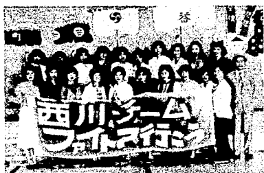
▲私たち美人でしょう？

去る五月三十日、BSN(新潟放送)「あなたのチャンネル奥様の舞台」に、西川町を代表して押付部落の農村若妻二十名が出演し、味方農協婦人部に挑戦しました。