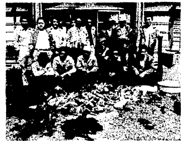
駆除した鳥獣の前に 猟友会員のみなさん