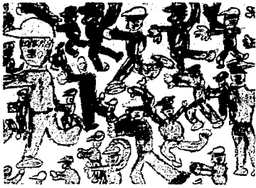
話題先生とおにごっこ