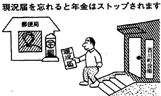
現況届を忘れると年金はストップされます

国民年金の老齢年金(通算老齢年金を含む)の事務は、東京の社会保険庁で行われています。年金は、みなさんが裁定請求の際に希望した金融機関を通して、年に四回(通算老齢年金は年に二回)支払われます。 この年金の支払いは、社会保険庁が毎年みなさんの生存などを確認したうえで行われています。みなさんが、年金を引き続いて受けるためには、年一回、社会保険庁に生存していることの証明を提出しなければなりません。 このことを、現況届(国民年金受給権者現況届)といっています。 現況届は、昭和五十三年二月十五日以前から年金を受けている人は必ず提出する必要があります。現況届の用紙(ハガキ)は一月十五日ごろまでに、社会保険庁から受給者あてに直接郵送されます。受給者のみなさんは、その用紙に住所、氏名を記入のうえ(押印を忘れずに)、町長の証明をうけて二月十五日までに必ず社会保険庁に提出してください。 なお、現況届が期限までに提出されないと、引き続いて年金を支払っていかどうかの判断がつかまないので、届が提出されるまでの間、年金の支払いを一時差し止められることもありますので、ご注意ください。