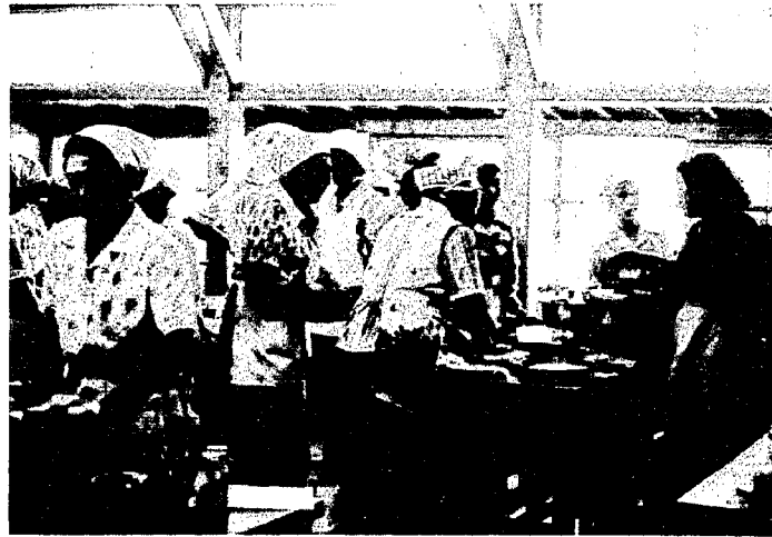
— みんなでワイワイ・ガヤガヤと…… —

でも大丈夫ではないかということ、初めての試みで少し不安でしたが夕食を共にするという目的でやってみました。さいわい会場が料理屋(山伝さん)でしたので、調理場も広く何もかもよく整っておりとても便利で助かりました。 公民館で習ったメン料理と保健所で習ったイワシの料理をやったのですが、メン料理の材料はこれ、イワシ料理の材料はこれと広い調理台の上で区分して並べ、すぐ料理