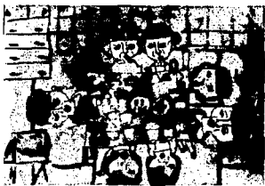
(この作品は、家庭の日をテーマ)とした児童の作品です。