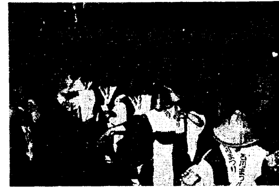
▲伝統の傘ぼこ盆唄をアレンジした「越後傘ぼこ盆唄」による大民謡流し(25日) (踊り子700人余が参加し夏の夜空をそめた)

今年で第四目を迎えた「西川まつり」が夏の夜空をそめ二十四日から二十七日まで四日間盛大に行われ、四百年余の歴史をもつ古式豊かなみこしや盆ぼこ行列を中心に数々の趣向をこらした行事が観衆の目を十分に楽しませた。その祭りをカメラでおってみました。