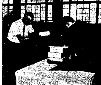
▲今年も10組の金婚者に祝品が手渡されいっそうニコニコ顔／