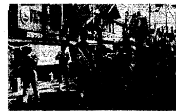
▲自衛隊新築田音楽隊のパレード(26日)