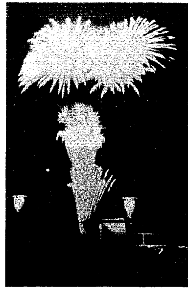
▶26日、27日と夜空に美しい花を飾った花火大会「ア／あがった／あがった／ワ／きれいだなあ...」