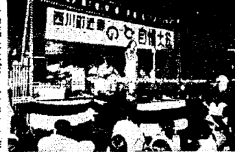
▲會根神社境内で行われたのど自慢大会(24日)