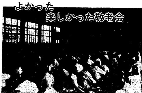
よかった 楽しかった敬老会 ▲ひと足早く毎年9月1日に行われ公民館長、町長ら関係者から祝われた敬老会 今年の対象者620名、うち450名が出席し楽しい1日を過ごした。