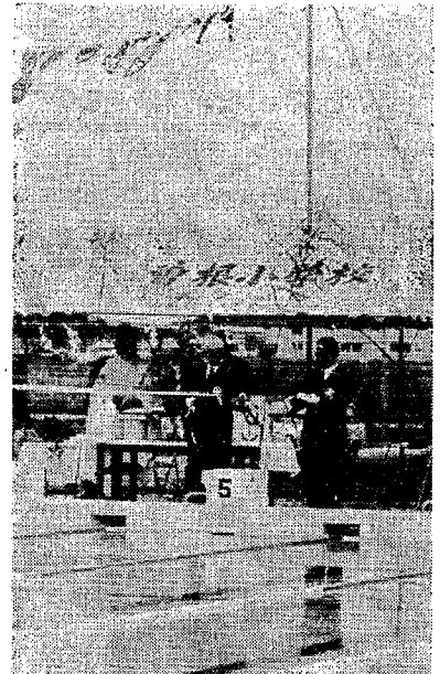
△テープカットで完成の実感もひとしお (町長, 教育委員長)