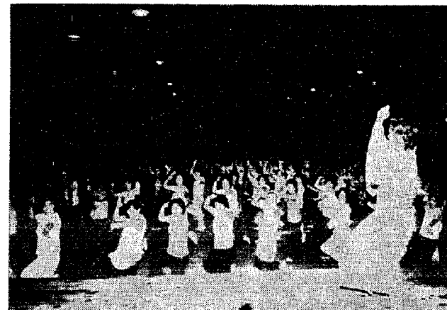
今年のまつり民謡流し