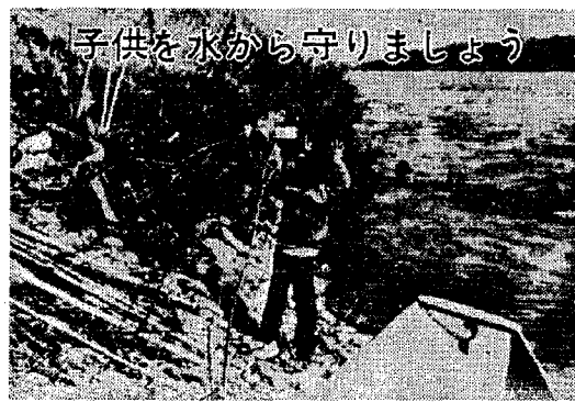
子供を水から守りましょう