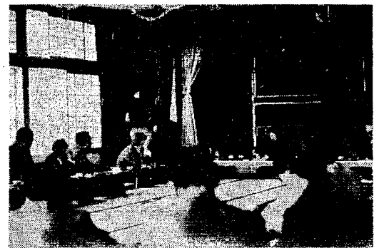
新しい制度について研修を受ける年金委員 (いこいの家で)

当町には、国民年金委員さんといつてみなさんの相談におこたえしたり、国民年金のことについて身近かな相談相手をつとめている人がおられます。 国民年金は、みなさんもお承知のとおり、農業や商業など自営業の人、またはそれらの家族の人が加入している地域の人々のための年金制度ですが、自主納付、自主申告といつて、保険料の納入やいろいろの手続き、届け出は、加入者自身が行なうことになってい