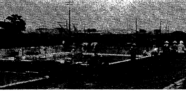
完成を目前に最後の仕上げを行なう町民プール(七月一日撮影)

日時 七月十七日(水) 鏡郷小学校プール 午前九時お祝い、テープカット(花火打上げ)模範水泳 町民プール 午前十一時お祝い、テープカット(花火打上げ)模範水泳 午後零時三十分から曾根小学校体育館で、合同の完成式を行ないたいです。