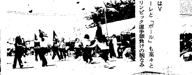
サインはV ソーレと「ボール」も高々と オリンピック選手顔負けの腕まみ