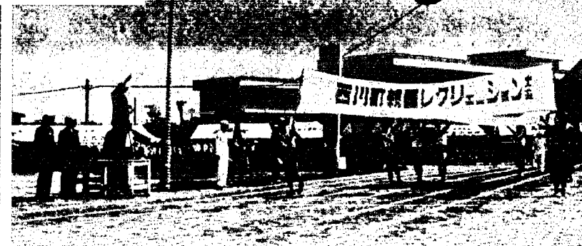
大会の花形は入場行進から 役場職員によるプラカード、続いて国旗と…… ご苦労さんと手をふる大会々長もうれしそう