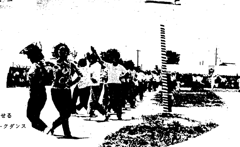
観衆の目を楽しませる 婦人たちのフォークダンス 五百人参加 みんな師匠なみ