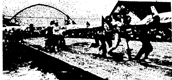
D51よ、さよなら 運転手さんしっかりと、乗客の女性軍はたのしそう!!