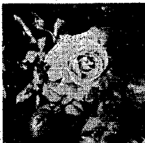
白バラは、明るい選挙のシンボルです。

町選挙管理委員会では投票率の安定と向上を図ろうと選挙のたびごとに、投票率の高い町内、部落を表彰する予定です。