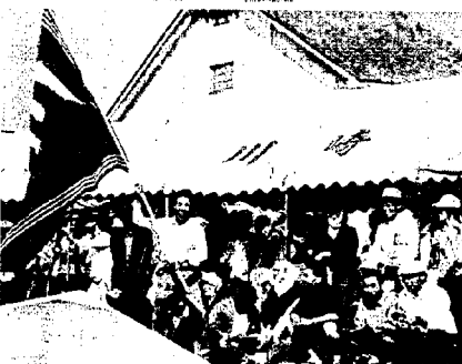
優勝の見通し強い 川崎チーム応援も一段と力強く