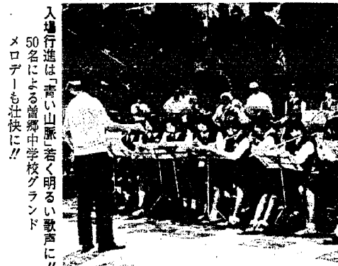
入場行進は「青い山脈若く明るい歌声に!! 50名による音郷中学校グラウンド メロデーも壮快に!!