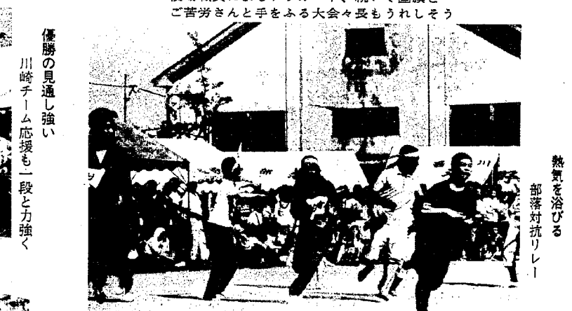
熱気を浴びる 部落対抗リレー