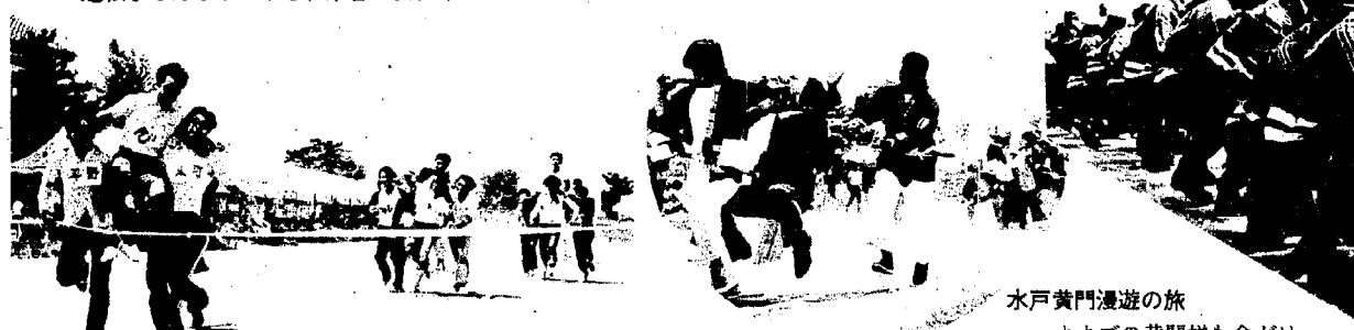
水戸黄門漫遊の旅 オカゴの黄門様も命がけ 助さん、格さんたのみますぞ!!