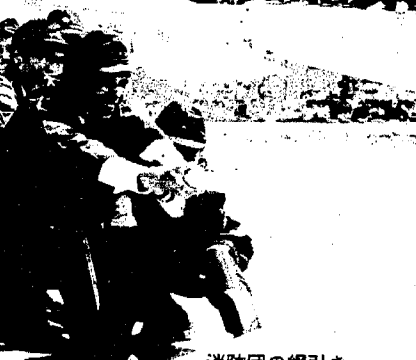
消防団の綱引き ソレ、頑張れ!!