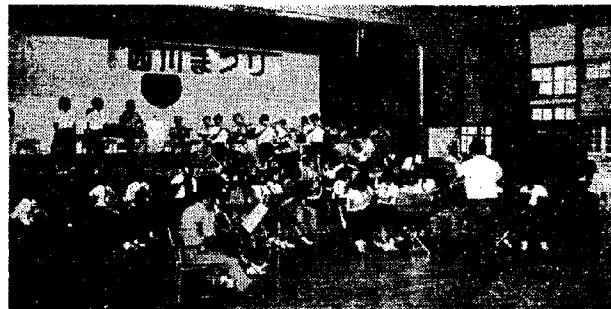
年々盛大になる民謡流し 1番町から8番町までを演奏しながら行進する自衛隊員 曾根中生徒と自衛隊員による合同演奏

れ、多数の観衆でにぎわいました。大会は、民謡クラブ員の歌う佐渡おけさと岩室草香句で、仮装に参加した若者男女が入り交って踊り、会場は、ちよちんの光や、夜空を彩る大小の花火の打ち上げられる中を、審査のかたから、町長や商工会長らが、ゆかた姿で先頭を切っていました。