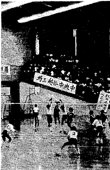
▲第二セット、田崎中のスパイクを升潟中あざやかにブロックする

対戦相手の田崎中学校は九州で一、二を争う強チームとのうわさがあり、升潟中チームでは県大会と同時に全国大会に備え長い間、