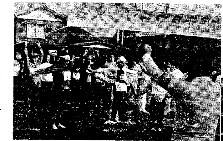
さあ元気で走ろう そのために先づ準備体操を!

B両コースとも同時に役 場前をスタートしました。 沿道には、元旦早朝にも かかわらず多くの町民から 声援を受けながら、まず、 Bコース(1km)のランナ ーがゴール、つづいてAコ ース(3.1km)のランナ