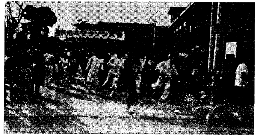
午前10時参加者 150余名が一齐にスタートA、Bコースにわかれて

始めておこなわれた「町 民元旦マラソン大会」は、 さいわいにして、おだやか な春の陽気に恵まれたた め、一五〇名もの多数の方 々の参加を得て、午前一〇 時、体育協会会長の持つビ スタールの合図とともに、A