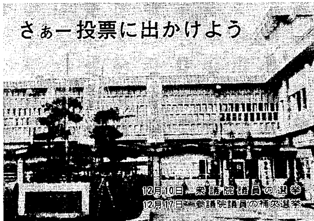
さあ一投票に出かけよう