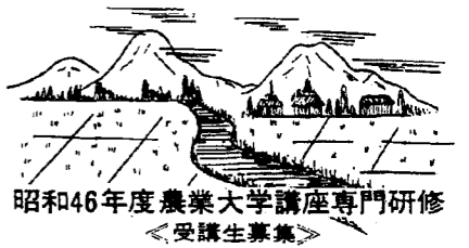
昭和46年度農業大学講座専門研修