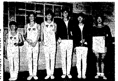
優秀賞(第三位) (九月二十三日、高田市成 西中学校)