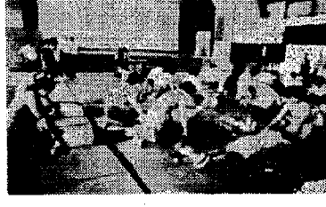
写真は新潟中学校で行なわれた人口呼吸の講習風景

をお願いいたします。 道路の正しい利用 道路を不法に自動車、自転車、商車、資材等の置場又は作業場として使用している場合は、すみやかに中止し、それらの物件等を除去する。 道路に、土砂、ごみ等を捨てない。 道路を不法に占用している物件については、直ちに除去又は所定の手続をとるようにする。 煙草のすいがり、紙くず、空きかん等を道路に捨てないよう。とくに高速道路。 車両の積載土砂等が、こぼれて道路を決損することのないよう。