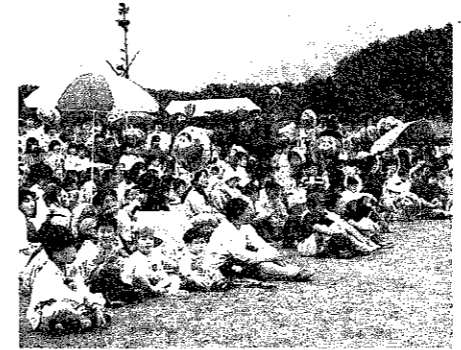
▲セラールマンショーに子どもたちがいっぱい……