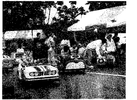
▲アンパンマン・バイキンマンにのって