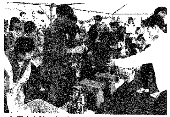
▲高さを競った・空きかんタワー