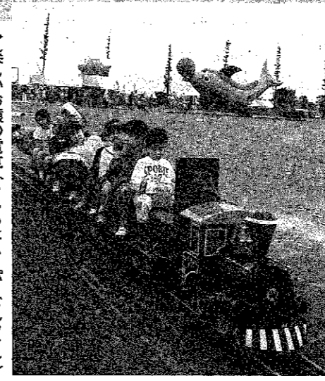
楽しいお猿の電車(うしろはスーパードルフィン)

六月三日、四日の二日間、さわやかな緑に囲まれた城山運動公園の芝生広場を中心に楽しい遊園地「ファミリーランド・城山」が開かれました。乗り物で高さのあるスーパードルフィンやお猿の電車、バッテリーカーなどには列ができ、ぬいぐるみ相撲大会にも多くの子供たちが次々とチャレンジして好取組が続き、二日間で約四千二百人の家族連れでにぎわいました。また、かわいらしいヨロヨロやヒジジ、インコ、うさぎなどを手で触ったふれあい動物園やセラールマンのぬいぐるみショーなどは子供たちの人気を集めました。 わたあめ、ポップコーン、コンビニヤクおでんもサービス。お昼には、ファミリーランド・城山の名物「越王なへ」のトン汁を味わい、家族そろって楽しい日を過ごしていました。