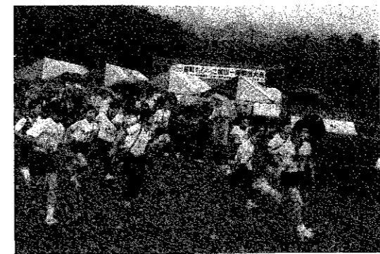
▲声援を受け、元気にスタートする子どもたち

贈られました。 この大会は、一人でも多くの子供たちが駅伝を通して手渡すタスキに友情と協力の汗を流し、スポーツの喜びを学びとるとともに児童の健全育成を図ることを目的に実施されました。 【男子の部】 優勝 松野尾オールスターズA 40分45秒 二位 浜つ子ライオンズA 41分24秒 三位 松野尾オールスターズB 41分42秒 【女子の部】 優勝 巻ジュニアバレーボールクラブA 43分48秒 二位 巻ジュニアバレーボールクラブB 44分51秒 三位 竹野町、F-1ガールズ 45分04秒