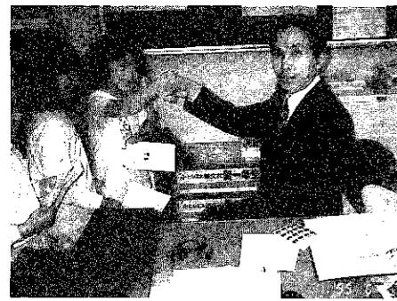
▲ちょっとドキドキした先生との握手…