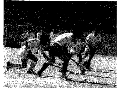
▲一瞬の間を抜いて

六月十一日、夏を感じさせる暑い陽射しの中、城山運動公園多目的広場で巻町長杯争奪ホッケー大会が行われました。大会には、一般、大学、高校