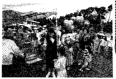
▲食べものサービスコーナー