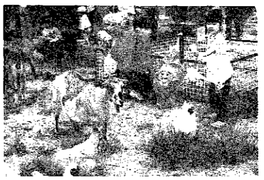
▲動物たちとふれあって……