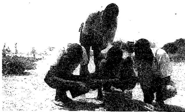
▲村の人たちと井戸水の水質検査を行う。

水が枯れようとしている井戸の掘り直しが必要なのだが、その後、センヌ氏が村をまわり、そのための費用を村人に協力を求めたがなかなか思うように集まらない。