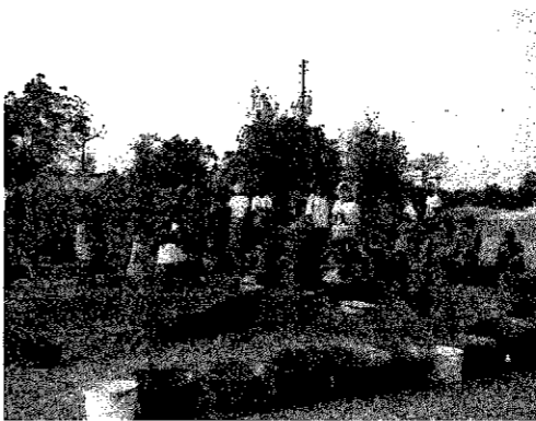
▲前の晩から共同水道にタライを置いている。