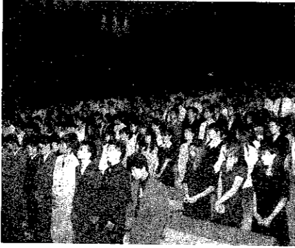
▲成人の誓いをする新成人

平成六年度巻町成人式が八月五日、巻町文化会館大ホールで新成人三百四人が参加して行われました。玄関ホールでは、友人たちとの再会に喜びあう歓声が響きわたっていました。