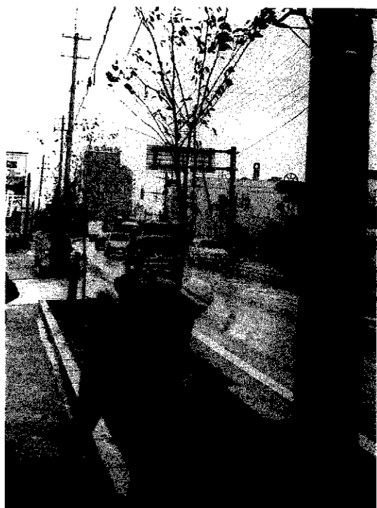
小雨の降る中、作業は行われる

「美しくきれいな町づくり」を目指す町制施行100周年記念事業「育てよう緑の並木道」は、十月十八日に国道横山バイパス線沿いに「けやき」四十五本を植樹したのに続き、この事業の協力団体である東六区国道街路組合でも十一月十三日、国道一六号線沿いに「けやき」の植樹を行いました。