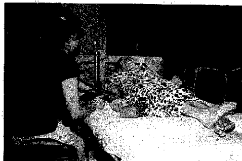
血圧測定・問診を行い健康状態を確かめながら、いろいろなアドバイス