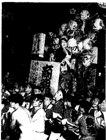
一般の部推薦作品「竿灯」

西中のホッケー部が出場します。各チームとも大会に向け、練習に余念がありません。みなさんの声援をぜひ、お願いします。