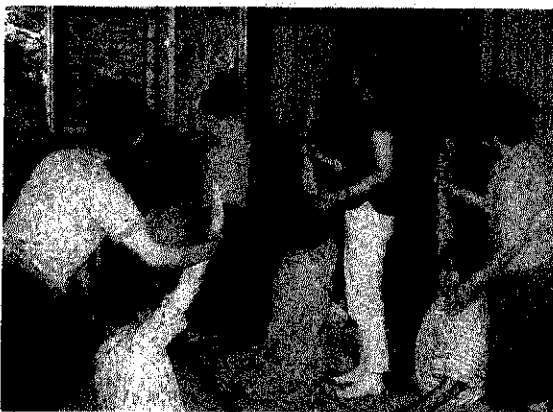
各地区で行われている健康づくり教室。栄養士と同席して、健康のための食事、簡単なストレッチ体操を指導。希望者には、血圧測定や尿検査などを実施

地域住民の健康管理指導や訪問指導などのために、国民健康保険特別会計予算より、巡回用の保健指導車一台が購入されました。その車を利用して活動をする保健婦さんをカメラで追いかけてみました。