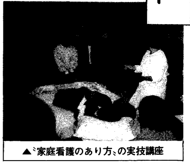
▲家庭看護のあり方、の実技講座

それと新発田市への視察旅行ですが、私は、給食の実態をもっと具体的に知りたかったです。しかし、あまりにも多方面に話しがわたり過ぎていて焦点が、はつきりしません。