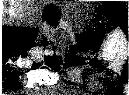
安心して生活できるお手伝いをします