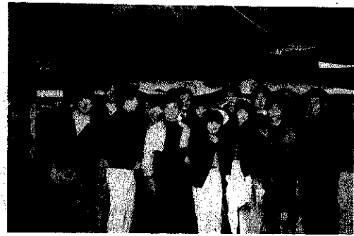
弥彦神社でポーズとる面々

これからの方向についてです。青年団は今、難しい時機を迎えています。団員が減り続け、行事をしても人が集まらない。周りか