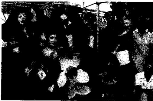
国際レジャー博覧会のにぎわい

の第一歩は空の玄関口、国際空港からとスケールが大きいのです。 建国以来二百年、観光事業に取り組んでから十七年と歴史の一分にも満たない今、日本に対して熱烈なラブコールを送っています。 も車の価格は日本の一・六倍もするのに乗ぶように売れるのだそう。さらに、車を大切に扱うので、日本ではもう見られないような旧式のものや堂々と市内を走り回っています。 オーストラリア人の考え方、生き方を学んだ面白い例があります。それは海外PR用のキャッチフレーズ。まったく知られていない国をどう売り込むかという語の移り変わります。 ◆初期、オーストラリア・イン・エキサイト ◆(未知の世界へ来てみませんか) ◆四、五年前、シンシアアリー・オーストラリア ◆(エリマキトカゲ、コアラのプームで日本の観光客が増え、オ