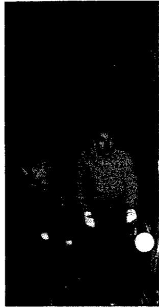
車椅子バスケットボールのメンバーの皆さん。明るく、バイタリティーがある。新潟市や豊栄市、荒川町からもやって来る。(20日夜、西川中体育館)

「新潟に戻ってからですね、バスケットに燃えたのは、しばらく脊髄損傷の人たちのチームと合同練習をしていましたが、頭損の仲間も加わり、練習場所も見つかったので今年十月にチームをつくり本格的に始めました。運動不足解消が目的だったのに今は生活の張りになっていきます。今月十三日の東京での全国大会では初戦敗退でしたが、『来年は頑張ろう』と思っています」