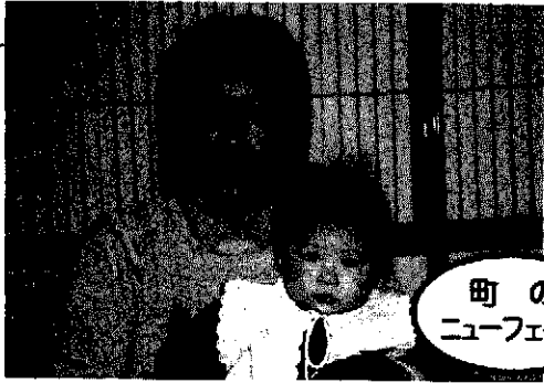
町のニューフェイス

十一月十日号の「お誕生おめでとう」が、小田寛児君の読みがなに誤りがありました。おわびをし、次のように訂正します。○よりよじ、○よりゆうじ