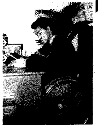
友歩会の書類を整理する