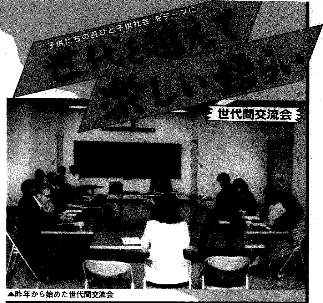
▲昨年からはじめた世代間交流会

町の数字一口メモ 172,992円 国民健康保険の被保険者1人当りの医療費(61年度)。また、同保険の被保険者1人当りの負担する保険税は58,944円(61年度)。