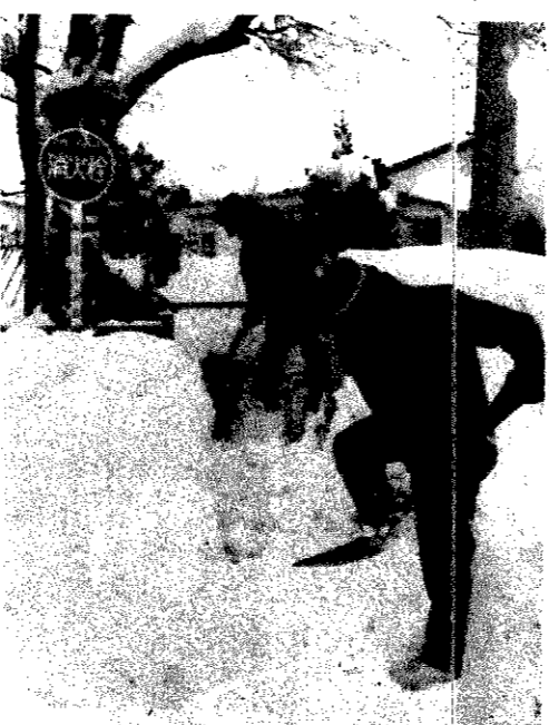
もしも火災が...消防水利の点検確保のため、パトロールは欠かせません

雪の壁が出入口をふさいでいませんか。万一の時いつでも逃げられるよう、避難口を二か所以上確保しておいてください。