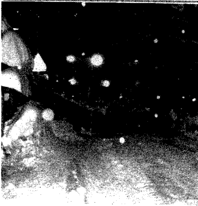
深夜から早朝まで、休みなく続けられる除雪作業

今冬は、平年より早く雪が降りました。町では、通勤、通学、消防、救急など、町民生活に大きな支障をきたさないよう、雪害防止計画を立てて維持管理に努めています。 しかし、急な降雪や多量の積雪には、作業体制にも限りがあり、いつも十分な対応ができるとは限りません。 降り続く雪の中でも、快適で安全な生活を送るために、町民が互いに理解し協力し合うことが大切です。