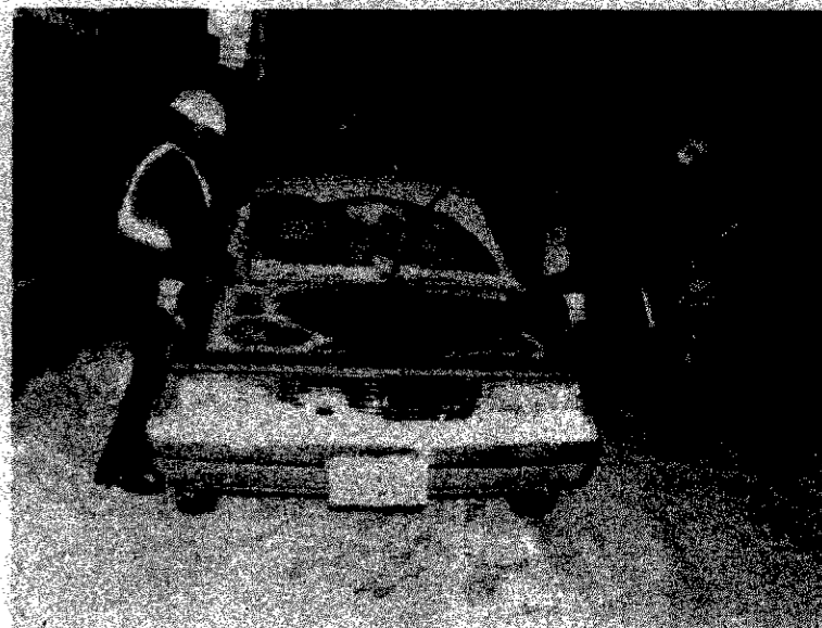
除雪の妨げになる駐車違反の取り締まりが続けられています

積雪が多くなると、道幅が狭くなったり、路面が凍って滑りやすくなり、消防車や救急車の現場到着に時間がかかります。 また、屋根に積もった雪や、雪下ろし後の雪が、思わぬ大きな災害を引き起こすことがあります。 気象条件が悪く火を扱うこと多い冬期間は、特に次のことに注意しましょう。