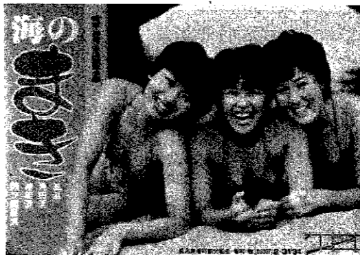
今年も巻の海へどうぞ

また、海開きに先立って六月二十日、「巻町海水浴場対策会議」が開かれ、警察署や保健所、土木事務所 昨年とは天候不順で四十万人と少なかったため、上越新幹線の開業などにより、今年は関東方面からの観光客の増加に大きな期待を寄せています。