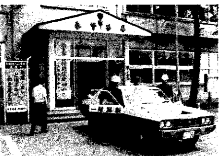
通報を受けて緊急出動するパトカー

六月二十五日の土曜日、シーサイドラインで深夜検問をしたんですが、あの夜はわずか三十分ぐらの間に酒気帯び運転、整備不良など七、八件の違反がありました。しかも十二時を過ぎているのに