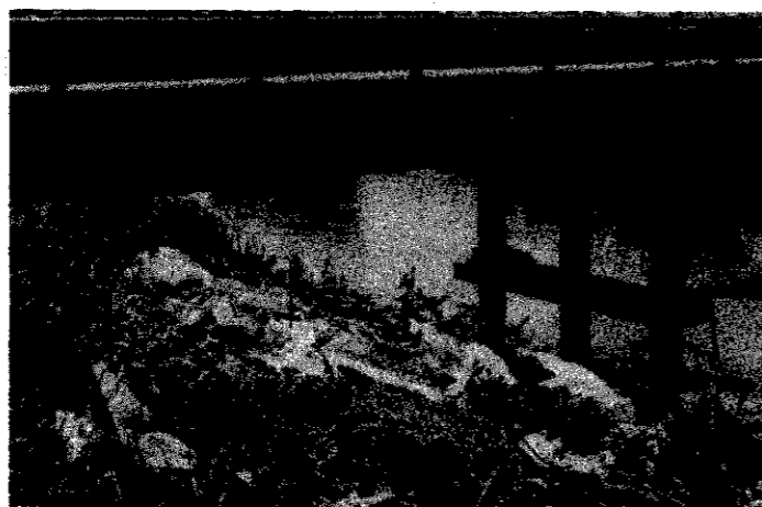
ゴミの不法投棄は自然だけでなく人の心も汚します