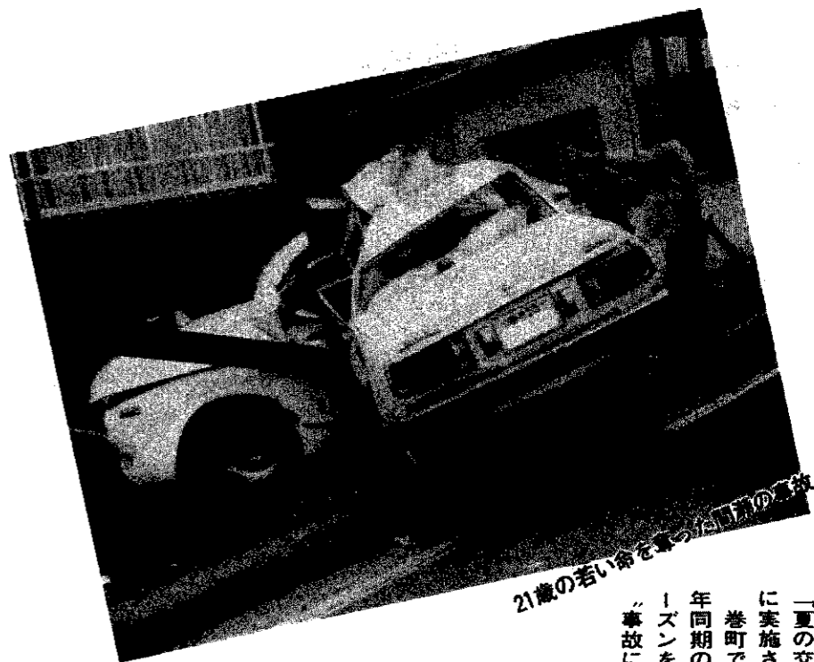
21歳の若い命を奪った夏場の事故

「夏の交通事故防止運動」が七月二十一日から八月二十日までの一カ月間、県下一斉に実施されます。 巻町では六月末現在、事故発生件数が三十三件(死亡一人、負傷三十六人)と、昨年同期の四十二件(死亡四人、負傷四十四人)に比べ減っていますが、夏の海水浴シーズンを迎え事故の多発が予想されます。町民の皆さんも「事故を起こさないよう」事故に遇われないよう、一層の注意をお願いします。