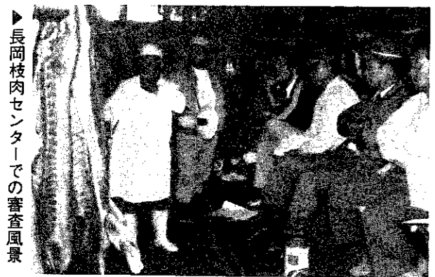
▶ 長岡枝肉センターでの審査風景

町主催の第二十二回巻町豚共進会が、十月二十二日開催されました。この共進会は、巻町における豚の産肉能力と生産技術の向上を図り、品質の均一化と畜産経営の安定助長をめざすために、毎年実施されているものです。