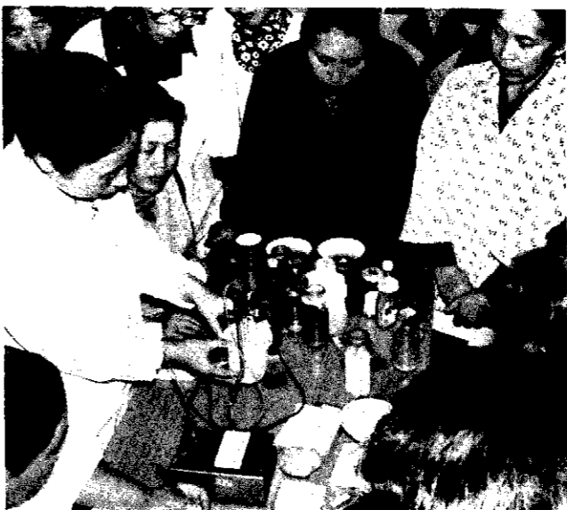
△町では、各地区で塩分を減らして栄養のバランスを考える「食生活講習会」を開いています。写真はみそ汁の濃度測定。

町社会課では、このほど老人の健康調査の結果をまとめました。この調査は昨年、独り暮らし老人の多い五ヶ浜と比較的老人人口の多い仁箇の二部落で、六十五歳以上の老人百四十八人を対象に行ったものです。五ヶ浜六十八人(男二十五人、女四十三人)、仁箇八十人(男三十二人、女四十八人)に、面接で、健康状態を中心に仕事や人間関係、楽しみ、食事など日常生活全般にわたって調査しました。