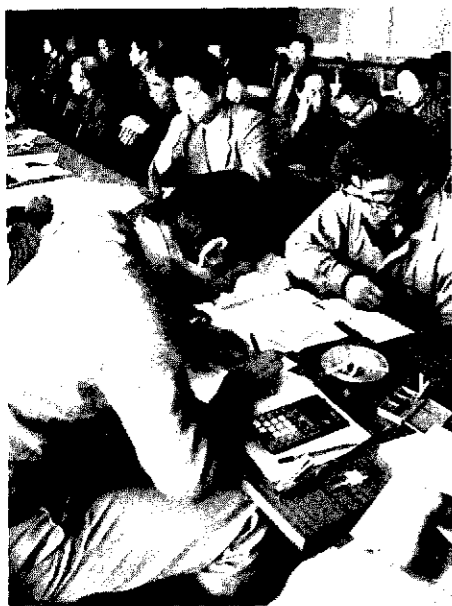
△昨年の納税相談風景