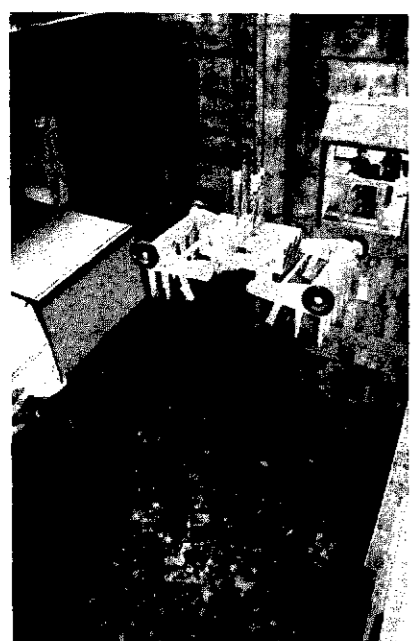
△ゴミ・ピット内部。まだまだゴミ分別がされていません。