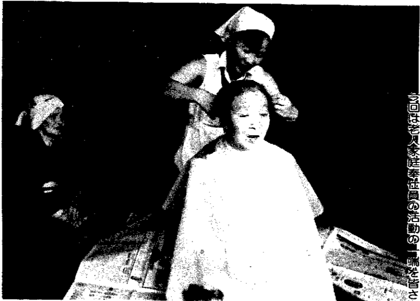
△散髪の間、ヘルパーさんとよもやま話

巻町には、一人暮らしで六十五歳以上のお年寄りが百八十四人(四月一日現在)もいます。男性が三十七人、女性が百四十七人です。高齢や病気のため、身のまわりのことがままならないお年寄りもまた多いのです。町では、こうしたお年寄りに対する福祉行政の一部を町社会福祉協議会に委託し、入浴車のサービスや老人家庭奉仕員の派遣などを続けてきています。 今回は老人家庭奉仕員の活動の一端を皆さんにご紹介します。