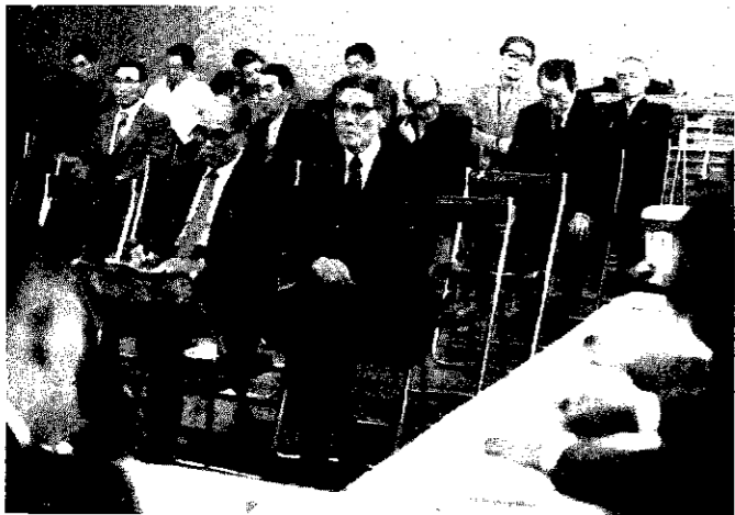
▲昨年の移動役場(巻地区)

町では、町民の皆さんとの対話を進めるため、次の日程で移動役場を7会場で開きます。皆さんから町行政に対する意見や要望、批判などをお聞きして、これからの町政運営にできる限り反映させていきたいと考えています。どなたでも出席できますので、気軽に近くの会場へおいでいただき、日頃考えていることについて話し合いませんか。