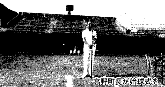
高野町長が始球式を

城山野球場の建設総事業費は、二億七千三百六十万円。財源内訳は、町の一般会計から六千九百九十三万円、国庫補助金六百五十