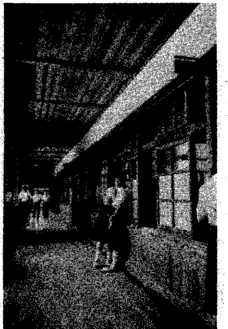
▲施設整備が待たれる中学校

前小学校の児童が進学する中学校の位置については、字横山周辺が適当と考へられます。 ※昭和六十一年の推計、生徒六百六十九人、現在定数十六学級編成