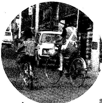
▲自転車に乗る人も交通ルールを守りましょう。

でも手軽すぎて、交通ルールを軽視している人が多いようです。自動車事故に比べて目立ちませんが、自転車の事故も少なくはありません。飛び出しや信号無視、突然の進路変更という無謀運転が、その多くを占めています。自転車は軽便であると同時に、不安定な乗り物でもあるわけですから、