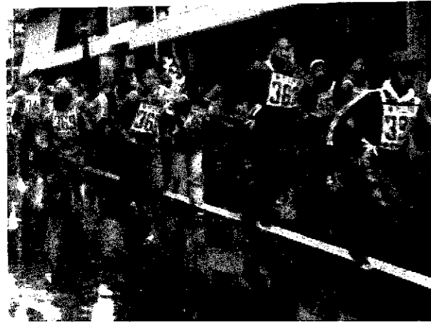
▲スタートノ走りぞめた。がんばるゾ。