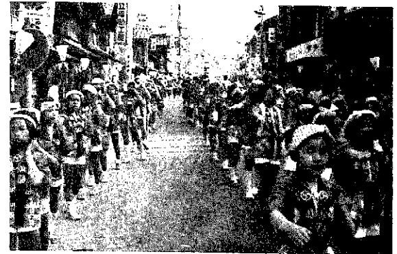
子どもたちも元気に山車に参加祭りを楽しみました

作業停電 東北電力(株)巻営業所では、次により作業停電をします。 ◇七月十五日 午前九時から午後一時まで松野尾、仁箇、布目の一部。 ◇七月十八日 午前九時から午後一時まで平沢、松郷屋の全部。