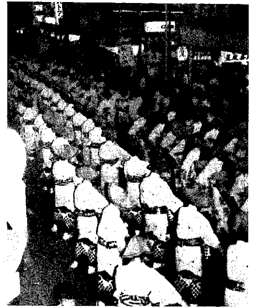
千人の踊り子が参加した前夜祭民謡流し