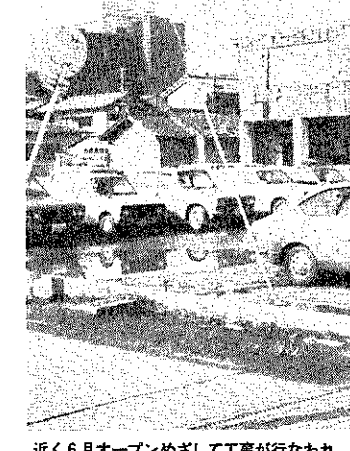
近く6月オープンめざして工事が行なわれ、駐車料金をまきました(町営駅前駐車場)