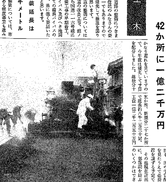
道路整備を最重点に予算を配分、生活環境条件の整備をめざしました。(馬場部路でうつす)