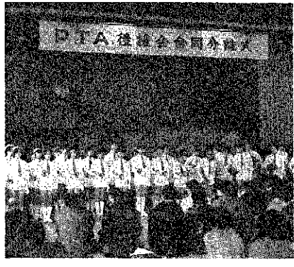
PTA後援会合同分離式

巻小・巻北小PTA、後援会が分離式 三月一日、巻小学校と巻北小学校のPTA(父母後援会)および後援会(巻原後援会)の、合同分離式が同校体育館で行なわれました。(写真)