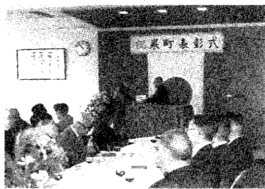
町発展に功勞のあった38人が喜びの受賞をしました(借組ホールで)