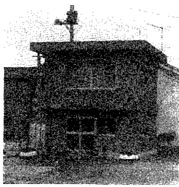
八月に完工した駅前派出所