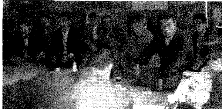
移動役場では道路舗装など住民生活に直結した要望が多く出された(入徳館分館で)

町では、町民のみならずとの対話を進めるため、十月十七日から二十八日まで町内十一か所で移動役場を開きました。これは町長の公約でもあり、みなさんの意見をこれからの町政に生かしていき