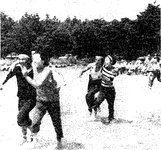
熱の入った松野尾地区運動会(9月1日井天原グラウンドでうつす)