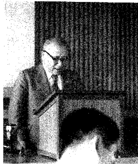
議会で所信表明を行なう村松町長(9月4日うつす)