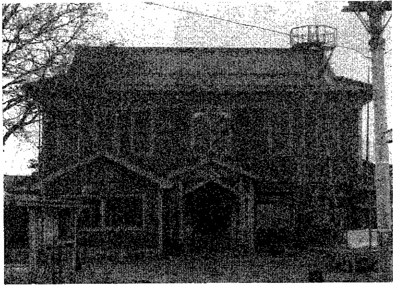
町民の学術文化の発展を願って設置された郷土資料館(旧財務事務所)