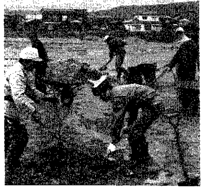
町営グラウンドに桜の木