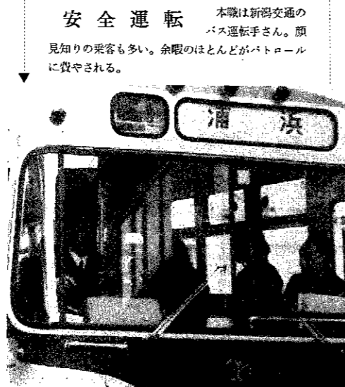
安全運転 本報は新潟交通のバス運転手さん。顔見知りの乗客も多い。余暇のほとんどがパトロールに費やされる。

郷土資料館を訪れた娘さんに展示品を説明する。その一語一語に、文化財に対する限らない愛着をこめ、先人の残した文化遺産の大切さを若い世代へ伝える。