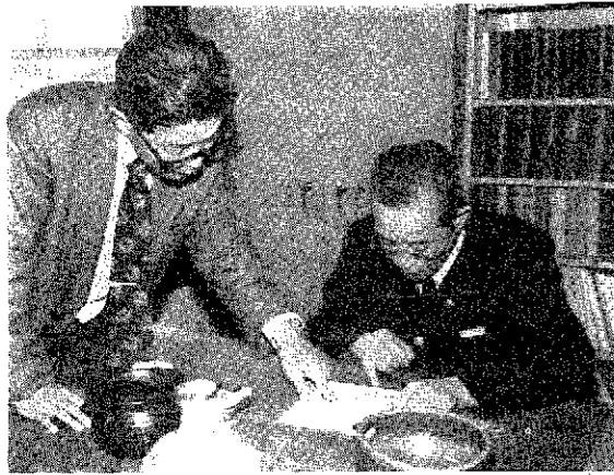
打ち合わせ 郷土資料館の運営委員も委員として、館長と話し合いをする。パトロール員の任務と深い関連もあり、いろいろ参考になる。