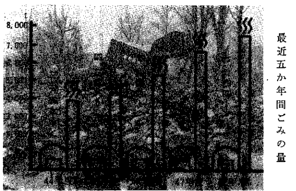
最近五か年間ごみの量

町民一人当たり昭和四十八年一年間のごみ処理費は(イラスト参照)千六百八十五円以内は収集費が九百一十二円、焼却費が七百七十三円となっております。 三つのおねがい 一、収集日以外にごみを出さないでください。 二、台所のごみは水分を十二分に切ってください。 三、ポリ袋、ダンボール箱を出す場合は、ひとりでしっかりこん包してください。