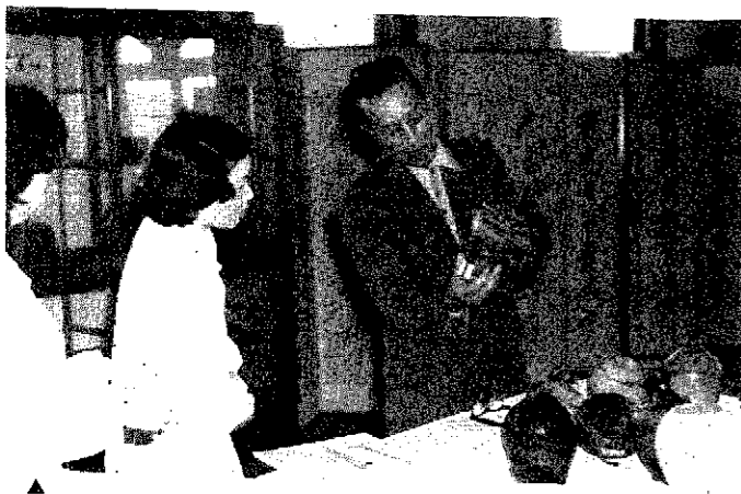
次代へ伝える 郷土資料館を訪れた娘さんに展示品を説明する。その一語一語に、文化財に対する限らない愛着をこめ、先人の残した文化遺産の大切さを若い世代へ伝える。