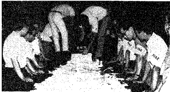
激戦に投票率も90%を突破、午後7時30分から巻小体育館で選挙職員の手で開票作業が始められた