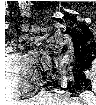
交通安全指導もさかんだ

四月 団体の協力を得ながら①運 故の撲滅に全力をあげま 六日(法廷車)の取り締まりや道路 歩行者、ドライバー、九 土)かの不法占拠物件の排除(幼 運管理者など町民一丸 日)児童交通安全クラブ(トキチ 連携)を通じて、春の交通安全 ら十五(月)やんクラブ)を通じて、親 となつて、春の交通安全 (ま)まで子くるみの交通安全教育を 運動をすすめ老人と子ど の十日 行なう③街頭指導や安全パ ともを交通事故から守つて 間、春 トロールを行なう④自転車 交通安全を推進する の全国 交通安全を推進する 交通安全 などを進めながら交通安全 全運動 が行な われま す。今年 は①歩 行者事 故、特 に子ども の事故防止 の重点 点に取り あげ交通 事故防止 の徹底を 図ること になりま す。 また、町 でも関係 機関、