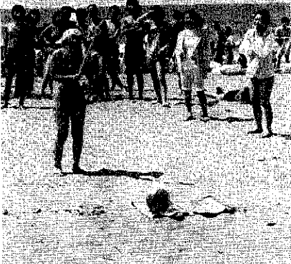
スイカ割りを楽しむ若者たち