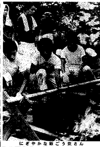
にぎやかな飯ごう炊さん