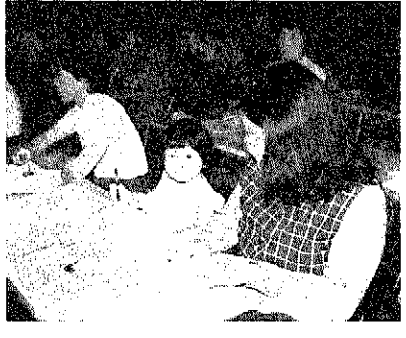
親子で参加の若い母親大学 六月十三日、公民館で若い母親大学が開かれ、三歳児をもつおあささんが集まり、子どものしつけや指導方法などを勉強しているものです。 会場には子どもをつれたおあささん一組出席し、親子そろってなごやかに先生の話を聞いていました。