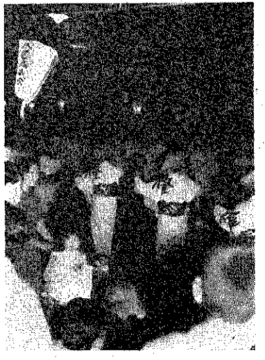
前夜祭の民謡流し(昨年うつす)

たのしみ、山車パレード、午後三時から町内を巡る。御慶舞、十五日午後一時、十六日午後三時から。民謡流し、十五日午後二時、十六日午後三時から。臨時露店市場開設、十四日午後から十六日終日。仲江通りでおもち、草花金魚店など百五十余店。