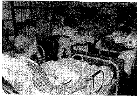
越前、角田保が白寿荘を慰問 越前保育園、角田保育園の両保育園園児の代表が、特別養護老人ホーム「白寿荘」を花束と遊戯で慰問、入院加療中のお年よりを喜ばせました。